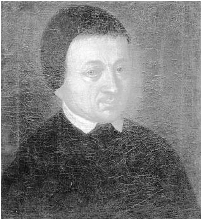
L'alpinist e perscrutader da la natira Placi a Spescha (1752–1833): «Pli starmentus ch'ìls pizs ed ils glatschers eran ... e pli grond ch'era mes regl da vesair e perscrutar els.»

(PICTUR NUNENCONSCHEIT; MUSEUM RETIC QUIRA)